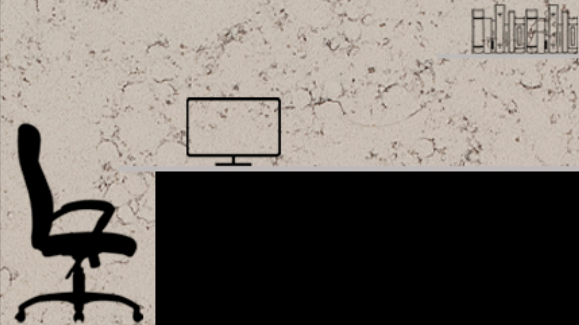
میز های کاری