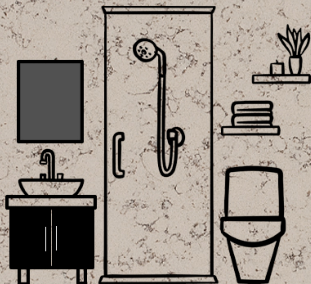
حمام و سرویس بهداشتی